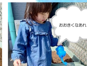
種の植え付け ベビーキャロット&ラディッシュ